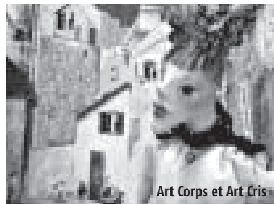
Art Corps et Art Cris

Création interdisciplinaire de vidéo vivante marionnettique adaptée à un public d'adolescents et d'adultes. Qu'ils soient réels, intérieurs, sociaux, imaginaires ou symboliques, les murs nous séparent-ils ou nous protègent-ils ? Nous avons tous nos murs à franchir.